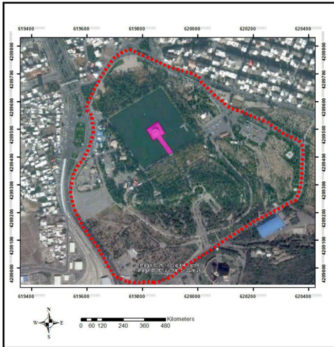
شکل ۱. موقعیت منطقه مورد مطالعه Figure 1. Location of the study area

گردشگری پایدار است. ادغام ساختارهای طبیعی (آب، گیاهان بومی و حیات وحش آبی)، عناصر ساخت انسان (عمارت کلاه‌فرنگی، پل‌ها و المان‌های شهری) و برنامه‌های فرهنگی-تفریحی، مقصدی چندوجهی خلق کرده که هم‌زمان نیازهای زیباشناختی، تفریحی و