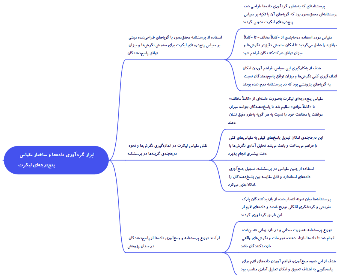
شکل ۲. مدل تحلیلی تحقیق

ندارد یا داده‌ها توزیع نرمال ندارند، بسیار مناسب و کارآمد باشد. یکی دیگر از دلایل اساسی استفاده از روش PLS-SEM، قابلیت آن در توسعه و آزمون مدل‌های نظری جدید و حتی ساخت مدل‌هایی است که هنوز به‌صورت کامل در ادبیات نظری تثبیت نشده‌اند. این مزیت به‌ویژه در پژوهش‌های اکتشافی که هدف آن‌ها تدوین چارچوب‌های نوین و بررسی روابط نوظهور میان متغیرهاست، بسیار حائز اهمیت است (Henseler et al., 2009). همچنین، توانایی این رویکرد در تحلیل